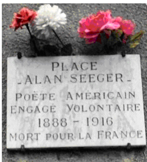
Plaque commémorative fixée contre le mur de la Mairie de Belloy-en-Santerre (80)

Jeune légionnaire, enthousiaste et énergique, aimant passionnément la France. Engagé volontaire au début des hostilités, a fait preuve au cours de la campagne d'un entrain et d'un courage admirables.--- Glorieusement tombé le 4 juillet 1916. (Citation à l'ordre du jour de la Division du Maroc, 25 décembre 1916.)